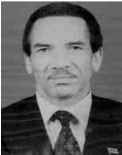
Staatspräsident Ian Khama: Verletzte er die Verfassung?

Dank des herrschenden Wahlrechts repräsentiert die künftige Re-