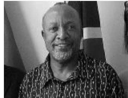
Swapo-Generalsekretär Nangolo Mbumba

Die aus dem Amt scheidenden Politiker können die bis dahin genutzten Karossen zu Sonderpreisen erwerben. Am Hungertuch werden sie nicht nagen. Dafür sorgt nicht nur eine opulente Rente, sondern auch die Prämie und zusätzliche Pension dafür, daß sie als Veteranen des Befreiungskampfes gelten. Darüber hinaus wurde bekannt,