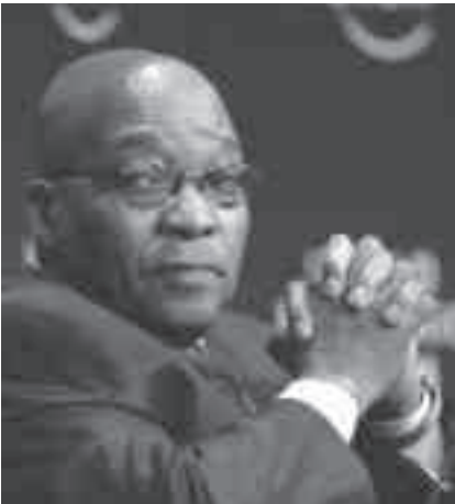
Zuma beim World Economic Forum on Africa, 2009

Wie Außenministerin Maite Nkomo-Mashabane in einem gleichzeitigen Interview in New York erklärte,