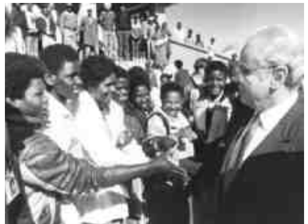
UNO-Generalsekretär Pérez de Cuellar 1990 begeistert begrüßt

S eit Erlangung der absoluten Mehrheit bei den Wahlen zur Verfassungsgebenden Versammlung unter Aufsicht der Vereinten Nationen im November 1989 konnte die SWAPO