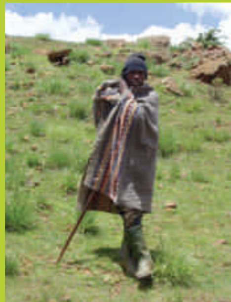
Ein Basotho-Hirte unterwegs