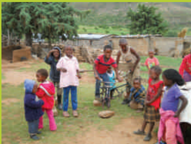
Kinder in Ha Machesetsa