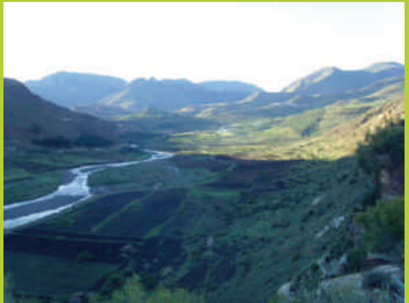
Blick auf den Quthing River bei Ha Machesetsa