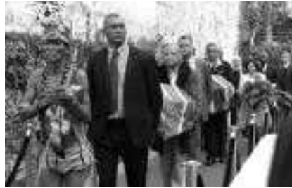
Restitution der von Pöch geraubten Leichnamensreste an Südafrika