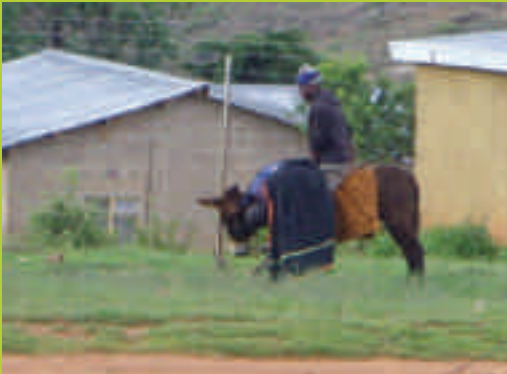
Manchmal hilft auch gutes Zureden