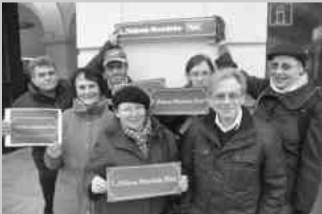
Symbolische Umbenennung des Museumsplatzes

In zahlreichen Gesprächen mit Vertreter/inne/n der Stadt Wien hat SADOCC in den vergangenen Monaten Kriterien für den „repräsentativen“ Charakter einer solchen Benennung formuliert. Neben hoher Visibilität u. a. spielt hier die Forderung nach einem innenpolitischen Konsens eine Rolle – weshalb unserer Ansicht nach kontroverse Vorschläge wie die Umbenennung des Luegerplatzes in Wien I. keine Zustimmung finden sollten.