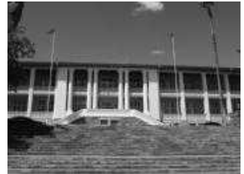
Abriß des Tintenpalasts? Nach dem Unabhängigkeitsmuseum ist eine weitere Bausünde im Zentrum Windhoeks zu befürchten

men bevorzugen. Eine demokratische Staatsform und Politikordnung war auch 25% der 25- bis 34-jährigen Befragten schnuppe, und 15% gaben nicht-demokratischen Systemen den Vorzug. Demgegenüber spielte die Religion in nahezu allen Altersgruppen eine vergleichsweise höhere Rolle und hatte mehr Bedeutung als die Politik. Das sollte schon deshalb auch den Politikern zu denken geben, da zu den Wahlen im November 2014 über die Hälfte der Gesamtbevölkerung unter 30 und mehr als die Hälfte der Wahlberechtigten jünger als 35 Jahre sein wird.