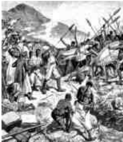
Höhnels aggressive „Entdeckungen“ in Kenya

Von allen „Afrikaforschern“ am bekanntesten ist zweifelsohne der