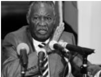
Michael Chilufya Sata