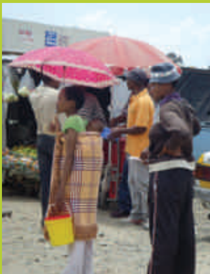
Am Busbahnhof von Mohale's Hoek