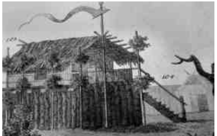
Stützpunkt eines Sklavenhändlers an der angolanischen Küste (sog. Guibangua)

Der durchaus feste, undurchdringliche untre Raum des Haupt-Gebäudes dient zur Aufbewahrung der armen Negersklaven, die der Europäer gekauft hat; ein kleines Fenster erleuchtet diesen Aufenthalt des Schreckens,