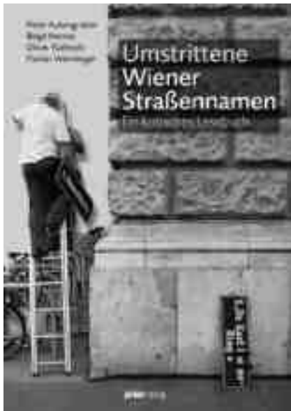
Expertenbericht: Jetzt als Buch erschienen

Mit Stichtag 1. September 2014 gibt es 6.696 Verkehrsflächen in Wien. Das Straßennetz ist mit rund 2.800 km ziemlich stabil, aber die Namen von Straßen sind eine lebende Materie. Jährlich kommen, je nach Bedarf, Namen hinzu. Eine Detailzählung ergibt, daß sich 4.247 Namen, also rund zwei Drittel, auf Personen beziehen. In den letzten Jahren ist dieser Prozentsatz sogar gestiegen.