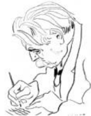
Schweitzer beim Verfassen seines Appells gegen Atomwaffen

Weitere Namen wären die Albert-Schweitzer-Gasse (1969), nach dem Arzt und Theologen Albert Schweitzer (1875-1965), der als Missionsarzt in Französisch-Westafrika (heute Gabun) bekannt wurde. Für sein Eintreten gegen die Atomrüstung erhielt er 1952 den Friedensnobelpreis. Im weiteren Sinne kann man auch den Eisenbahningenieur Alois Negrelli (1799-1858) hinzuzählen, zumal er ja die Baupläne für den Suezkanal mitentwickelt und vor Ort Recherchen angestellt hatte (Alois-Negrelli-Gasse, 1933).