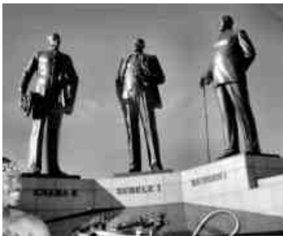
Volkstänzer vor dem Three Kings Monument in Gaborone. Die drei Tswana-Könige, die 1895 verhinderten, daß ihre Staaten dem britischen Imperialisten Cecil Rhodes unterstellt wurden (INDABA 23/99), werden in Botswana bis heute sehr verehrt. Die meisten Staatspräsidenten seit 1966 kamen aus der Khama-Dynastie.

der für andere Parteien abgegebenen Stimmen gibt. Das kann dazu führen, daß eine Regierung von einer Minderheit gebildet wird. 1999 zum Beispiel erhielt die BDP 54% der Stimmen, jedoch 83% der Mandate. Die Botswana National