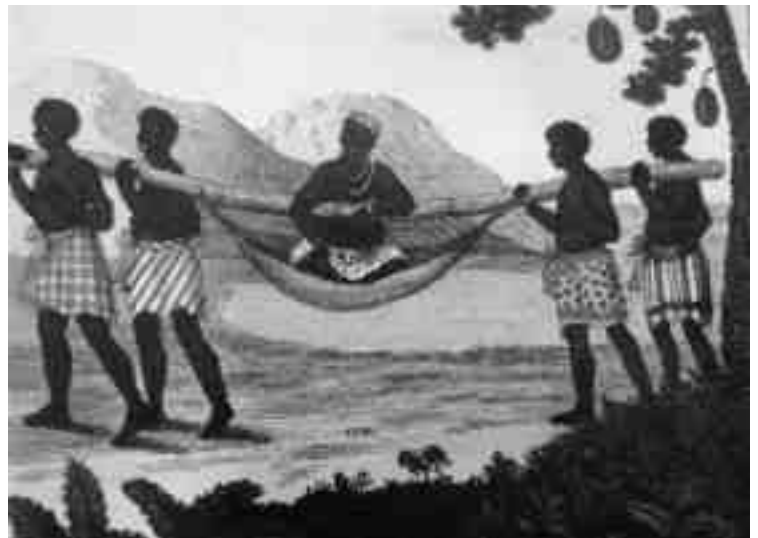
Angolanischer Würdenträger im Landesinneren