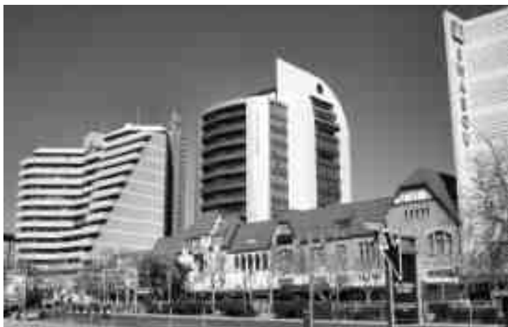
Kronprinz-Gathemann-Erkrath: Reste kolonialer Bautätigkeit in Windhoeks Independence Avenue

Die verschiedenen Epochen der namibischen Geschichte spiegeln sich in den Denkmalschutzbemühungen der jeweils verantwortlichen Regierungen wider. In der vorkolonialen Zeit war Denkmalschutz unbekannt. Die deutsche Kolonialregierung brachte erste Ansätze ein, als sie z. B. prähistorische Felsmalereien und -gravuren unter Schutz stellte. Zudem wurde die Ausfuhr von Meteoriten aus dem Schutzgebiet verboten.