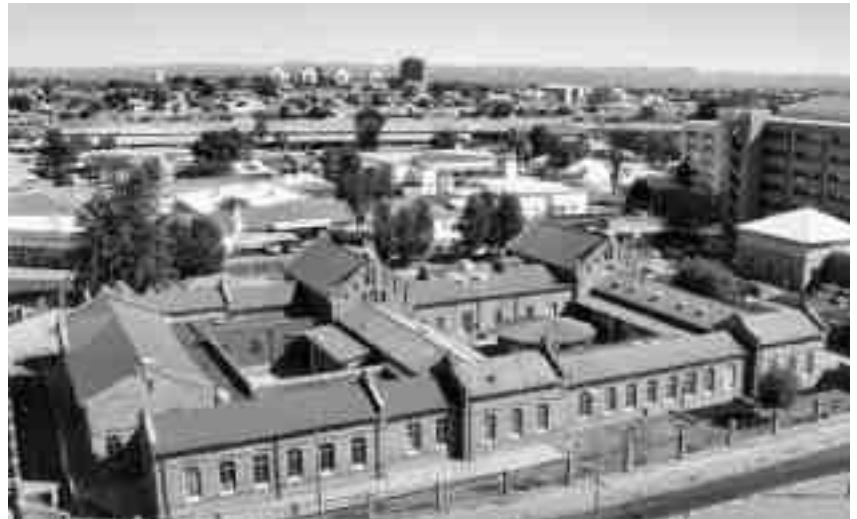
Ehemals Bezirksgericht, heute Veterinäramt in Windhoek

Das Zehnmannhaus in Windhoek (1906/07) bezog seinen Namen von den zehn unverheirateten Beamten, die in der Kolonialzeit dort wohnten. Das Gebäude ist in Staatsbesitz, wurde 1986 als nationales Denkmal proklamiert und wird heute noch immer als Beamtenwohnung genutzt. Es ist in seiner ursprünglichen Beschaffenheit erhalten und kann als geglücktes Denkmalschutz- und -pflegeobjekt betrachtet werden.