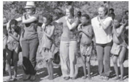
Lebend sind diese Museen insofern, als das Erlebnis auf Interaktion beruht.

Ein Touristenbus nähert sich dem San-Dorf. Er stoppt vor einem Schild, das die Besucher willkommen