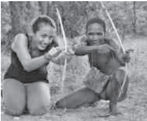
Lehrer und Schüler beim Bogenschießen im Lebenden Museum der Ju|'hoansi San von Grashoek

Kriterien und insbesondere auf eigene Rechnung geschieht. Viel zu häufig profitieren andere – zumeist große Reiseveranstalter und Tourismusunternehmen – von der Konstruktion exotischer Lebenswelten. Namibia beschreitet seit der Unabhängigkeit von Südafrika im Jahr 1990 einen neuen Weg. Gemäß der Verfassung (Artikel 95) sollen Naturschutz und nachhaltige ökonomische Entwicklung