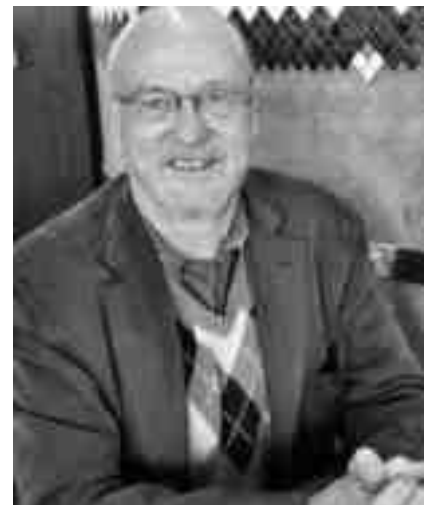
Tourismusminister Derek Hanekom

Fußball-WM 2010 gewachsen und ist nun der dritt wichtigste Faktor im Bruttonationalprodukt. Nicht zuletzt hat der Fall des Rand, der in den letzten zwei Jahren mehr als 30% gegenüber dem US-Dollar verlor, Südafrika zu einer relativ billigen Destination für Besucher/innen gemacht. Trotzdem sind die Einreisezahlen heuer gesunken. Sowohl der Kruger National Park als auch der Tafelberg in Kapstadt verzeichneten einen Rückgang, besonders stark fiel dieser jedoch mit minus 38% bei China aus, das sich in den letzten Jahren im Südafrika-Tourismus stark entwickelt hat.