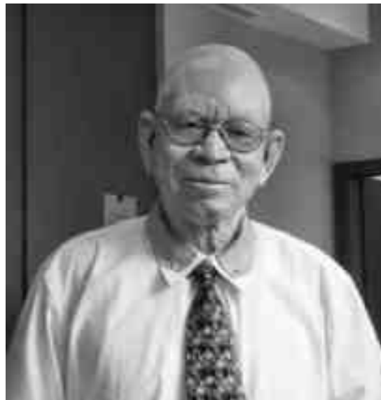
Bischof Zephania Kameeta

Und bei den Mieten gibt es auch keine Kontrolle – das ist einer der Fehler, die wir gemacht haben. Jede Kontrolle wurde als Rückfall in die Zeit der Apartheid betrachtet, auch Preiskontrollen. Das hab ich nie verstanden.