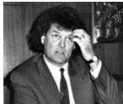
Lubowski im Juli 1988 in Wien

Auch auf symbolischer Ebene ist Präsident Geingob die Überwindung einer jahrelangen Blockade gelungen.