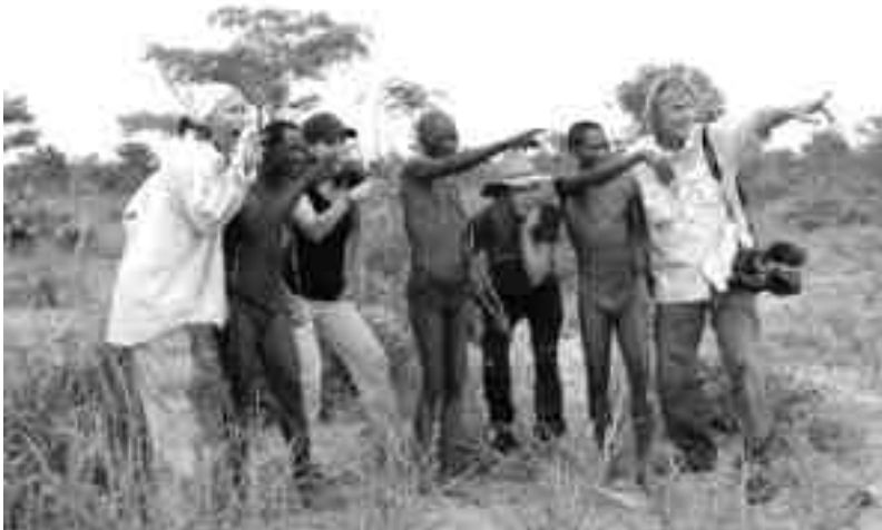
Zur Überraschung unseres „Jagdverbandes“ verfolgt uns ein unbeeindrucktes Kudu

uns stolz. So rückständig und nutzlos, wie wir früher betrachtet wurden, sind wir offenbar doch nicht. Jetzt beneiden uns viele andere Leute in Namibia. Mit den Geldern für die Fotos, die Eintritte ins Kulturdorf und den Einnahmen aus