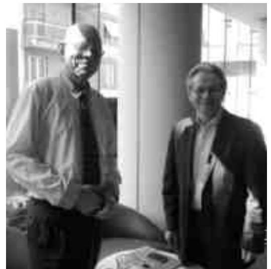
Nach dem Interview in Genf

Sie wissen sicher, daß ich die Idee des Grundeinkommens, des soge-