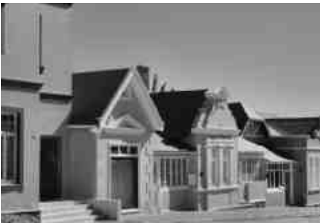
Architekturidylle im ehemaligen...

Namibia verfügt heute noch über das bedeutendste deutsche koloniale Bauerbe weltweit. Allerdings muß oft genauer hingeschaut werden, um dieses Erbe zu identifizieren. Erstens aufgrund natürlicher Verschleißfaktoren: Abgesehen von einigen Natursteinbauten waren die