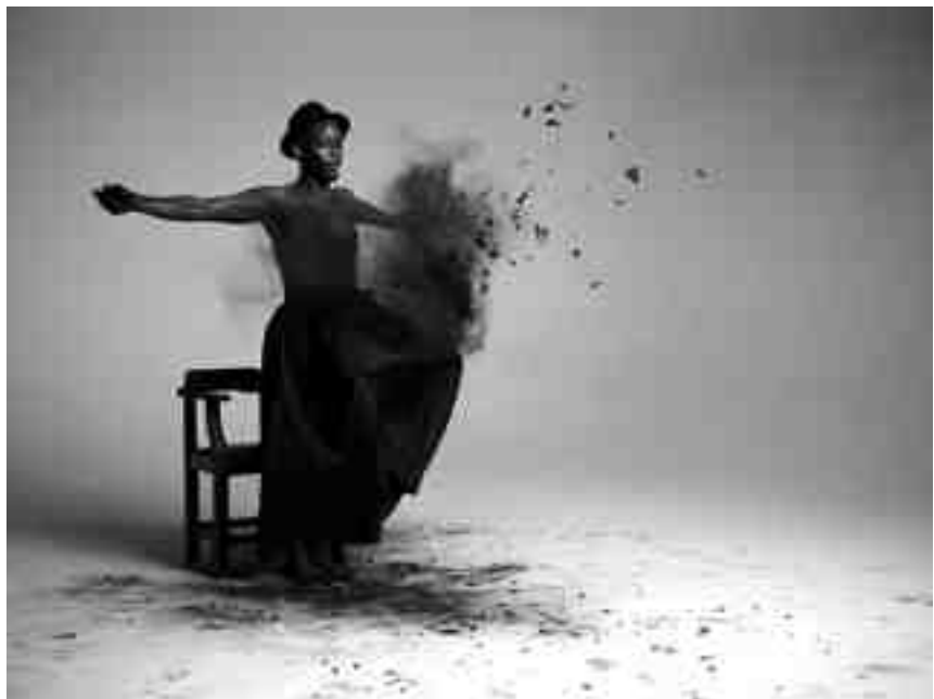
Aus dem Video „Inzilo“

Hut. Im Detail sieht man, wie er einzelne Requisiten in das Bild einbringt, wie z. B. Pferdescheuklappen, Peitschen und Macheten, die wiederum eine Referenz zum Bürgerkrieg und der Gewalt herstellen. Die Trauerrobe steht exemplarisch für das neue Südafrika, das im Spannungsfeld seiner belasteten